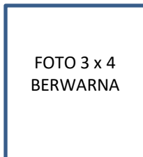
FOTO 3 x 4 BERWARNA